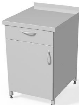
szafka jednodrzwiowa z szufladą WM3001