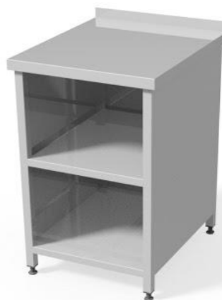
Szafka otwarta WM3003