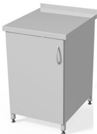
Szafka jednodrzwiowa WM3000