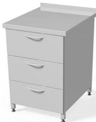
szafka z szufladami WM3002