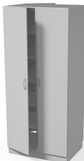
szafa przelotowa WM3107P