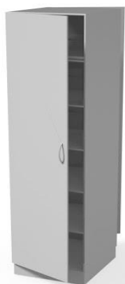
Szafa przelotowa WM3100P

Wyposażenie medyczne Szafy medyczne z funkcją śluzy/przelotowe