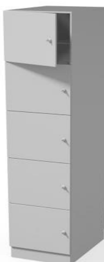
szafa przelotowa depozytowa WM3104P