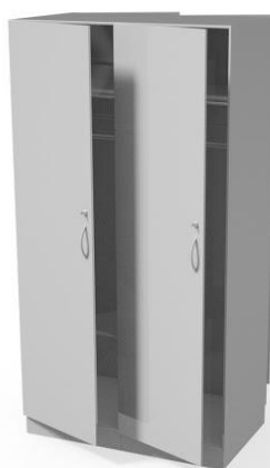
szafa przelotowa podwójna WM3103