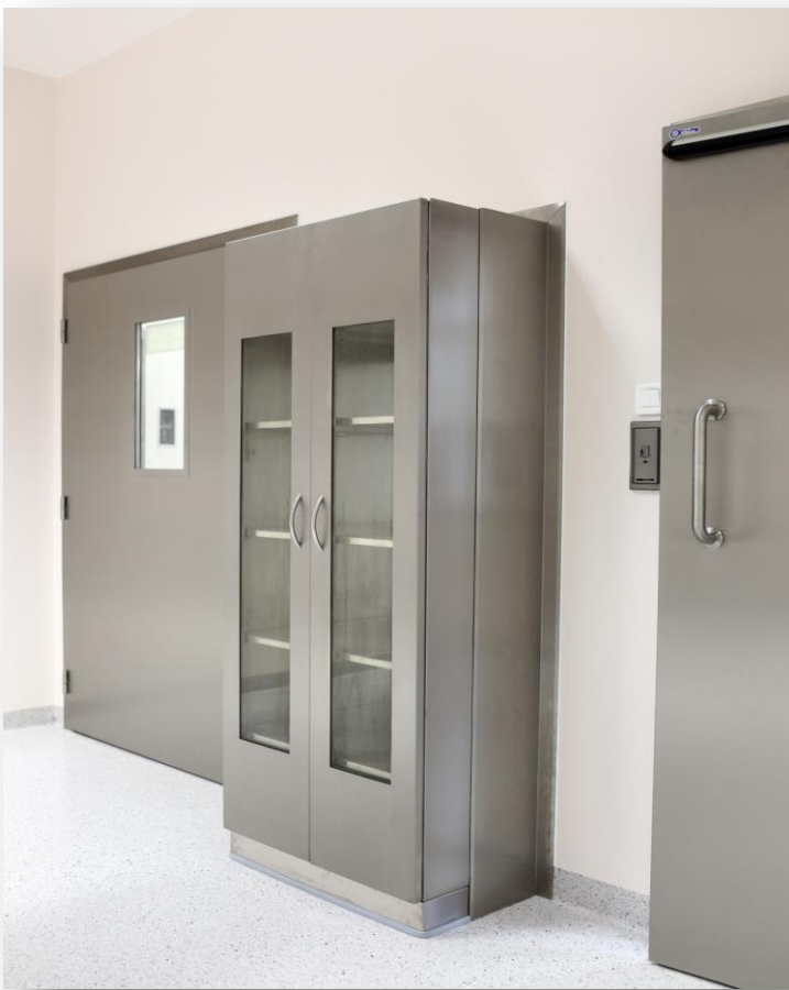
szafa przeszklona z drzwiami przesuwnymi WM3112P