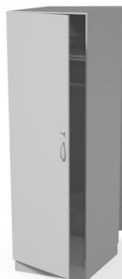
szafa przelotowa przeszklona WM3101P