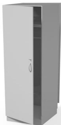
Szafa przelotowa WM3102P