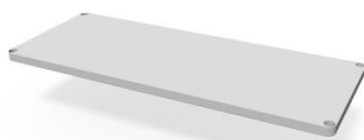
Półka do regału WM8100