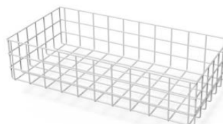
Kosz do sterylizacji WM8104