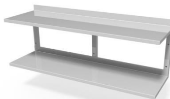
Półka ścienna dwustopniowa WM5002