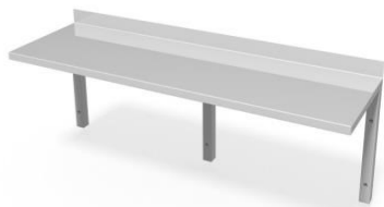
Półka ścienna WM5001